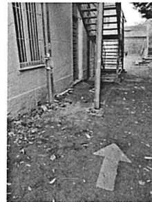
Basamento scala antincendio