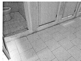
Gradino accesso water